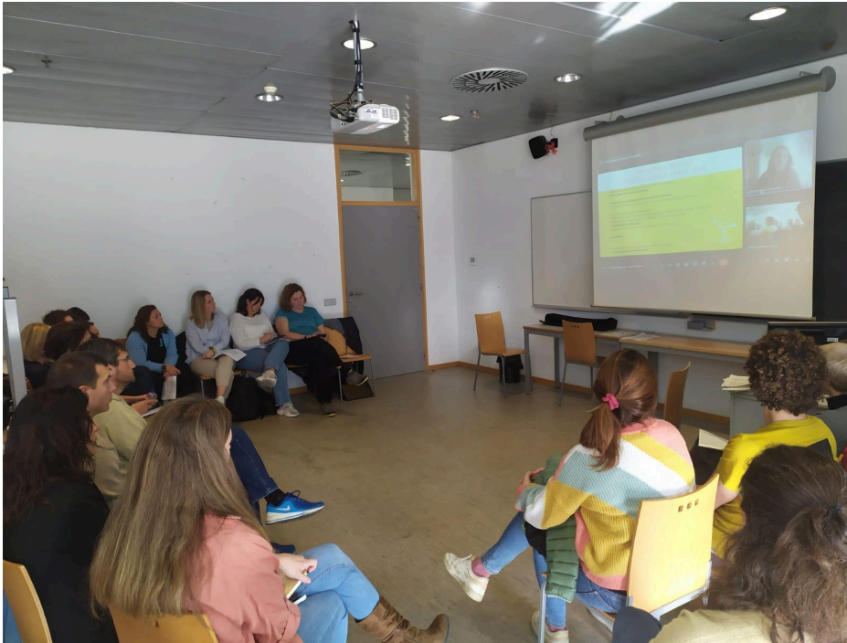
Presentació de l'ACPJ al Fòrum sobre Joventut de Lleida