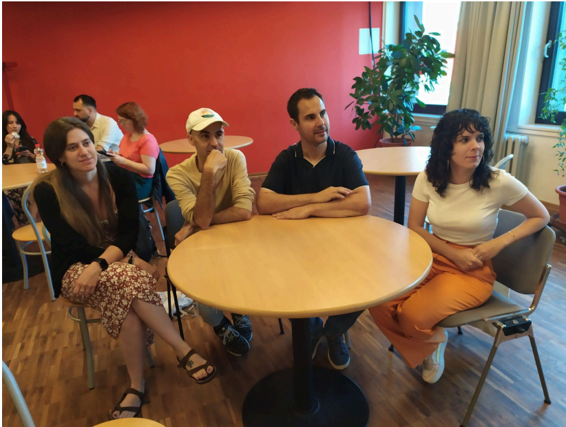
Conferència Final del projecte Democratic Innovations in Youth Work a Berlín