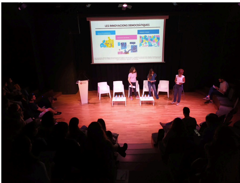
Presentació del Toolkit: "Democracy beyond voting" a la jornada Ei, tu! Parles de joves o parles amb joves?