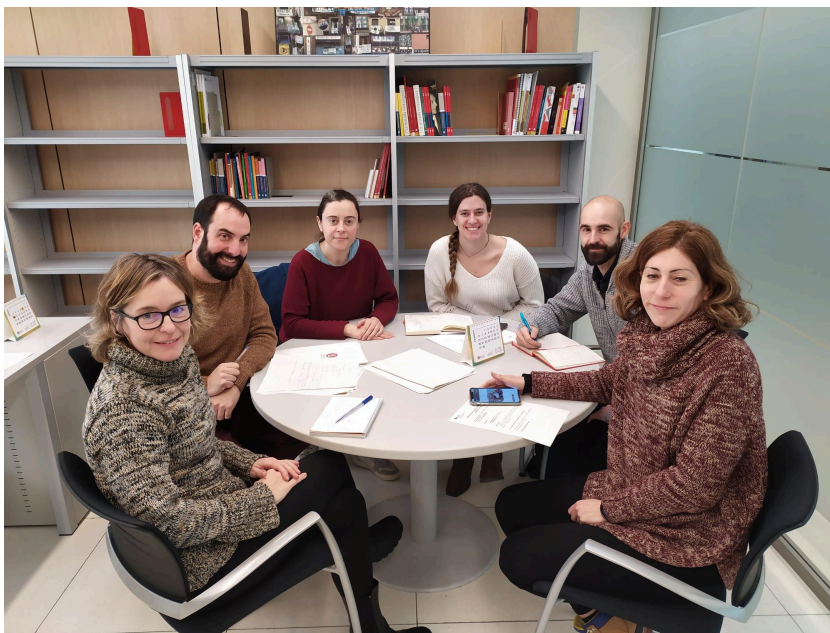
Reunió amb responsables de l'àrea de Joventut de la Diputació de Barcelona