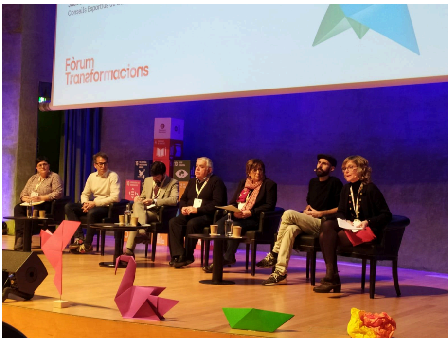
Taula rodona al Fòrum Transformacions