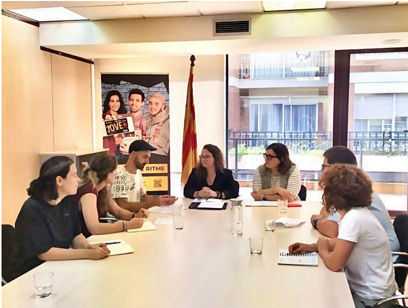
Reunió amb les responsables de la Direcció General de Joventut i de l'Agència Catalana de la Joventut