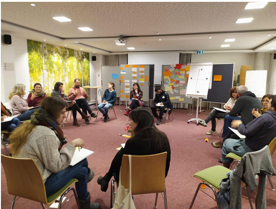
Formació sobre innovacions democràtiques en el treball amb joves a Berlín