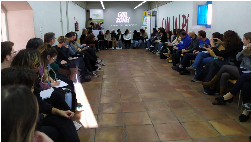
Jornada de Bones Pràctiques en l'àmbit de Joventut a Pineda de Mar