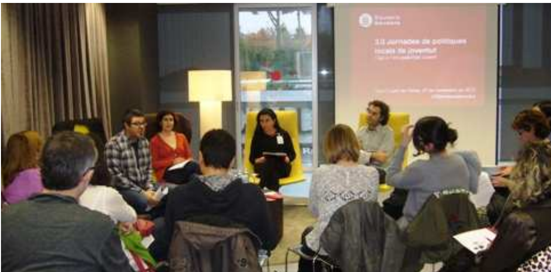
Participació de l'AcPpJ a les XXX Jornades de Polítiques Locals de Joventut: presentació de l'"Informe entorn les i els professionals i les Polítiques de Joventut". Notícia web que en fa referència: http://www.joventut.info/index.php?option=com_content&task=view&id=1104&Itemid=71