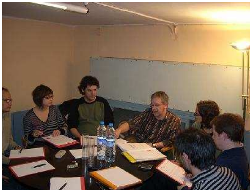
Comissió de seguiment del Curs 2008