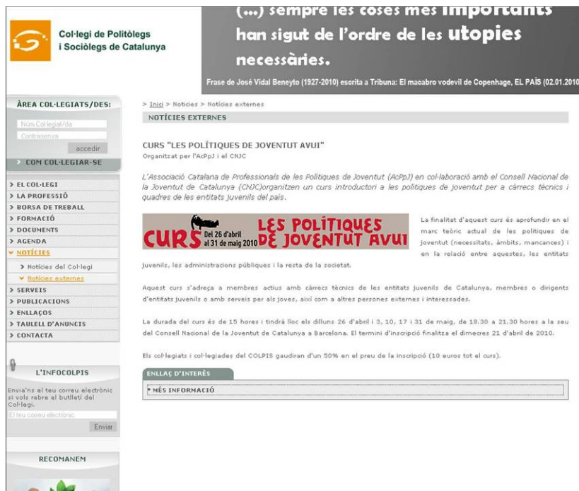
Difusió del Curs a la plana web del COLPIS