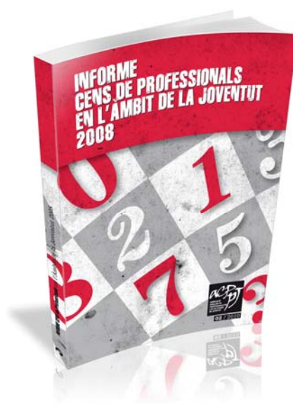
Invitació – Presentació – Portada de l'Informe del Cens de Professionals en l'àmbit de la Joventut 2008