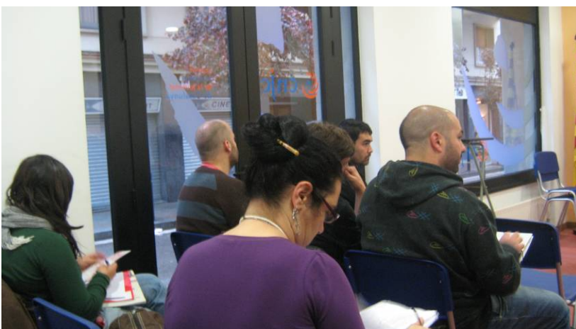
Alumnes al Curs