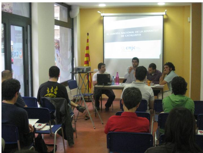
El quart mòdul amb el Secretariat del CNJC